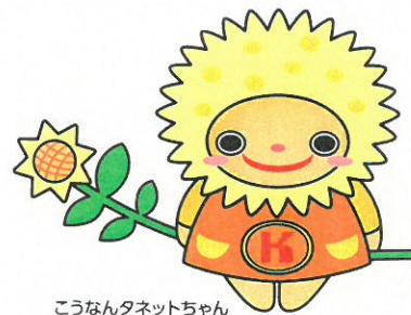
こうなんタネットちゃん

港南区民活動支援センターは「何かをはじめたい」や「活動を広げていきたい」など皆さんの自主活動をサポートします。