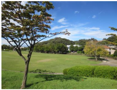
【写真】 ←レストハウス ↑芝生広場